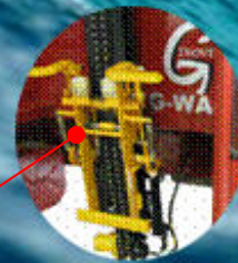
Verseur contrôlé par automate

Pompe à pistons 38 gpm/2600psi. de GINOVE